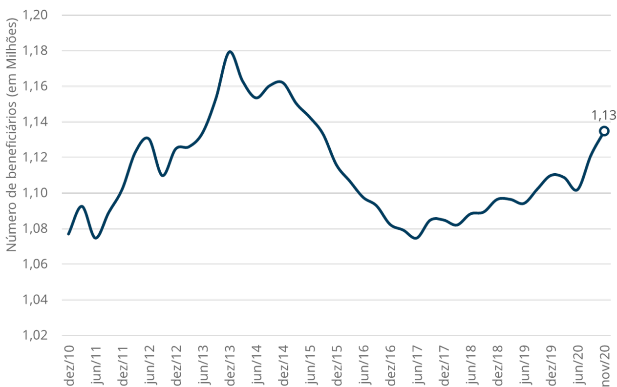
Gráfico 1 - Evolução do número de beneficiários vinculados a planos médico-hospitalares no estado do Espírito Santo entre dez/10 e nov/20.